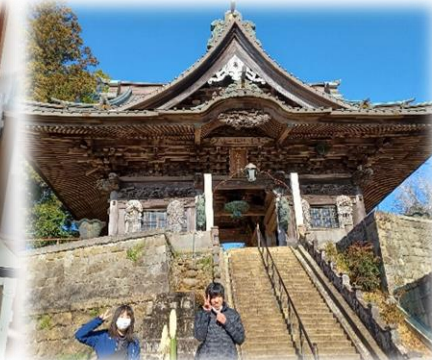
芝山仁王尊で初詣祈願！！