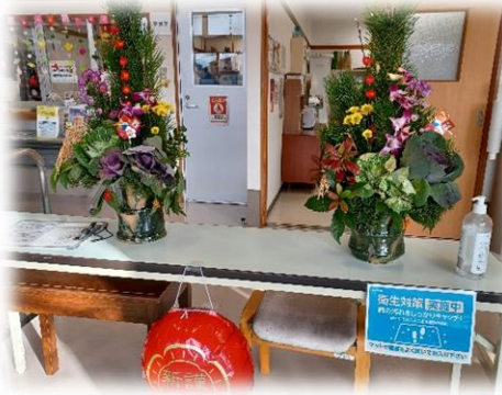
特製の正月飾りでお出迎え！！

2024年も「ウエルネス倶楽部・明朗カレッジ」は 障害のある方の就職活動をサポートします！！