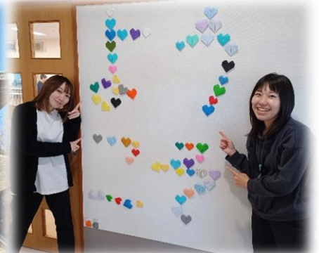
施設見学は随時お待ちしております！