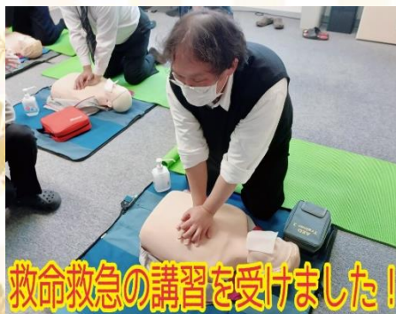
救命救急の講習を受けました!